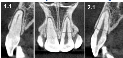
CBCT Previa. Cortes Sagital y Frontal