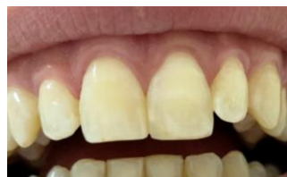
Control clínico y rx 9 meses