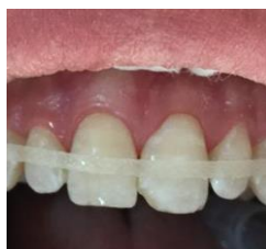
RX Previa y Férula flexible Interlig