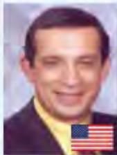
Prof. Ricardo Caicedo (USA)

"Nuevos avances en instrumentación rotatoria, obturación del canal radicular y la restauración corono-radicular"