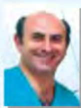
Emilio Manzur Workshops