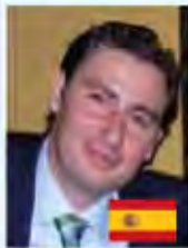
Prof. José Aranguren Cangas (España)

"El verdadero comportamiento de las nuevas nuevas limas NiTi en el sistema de conductos"